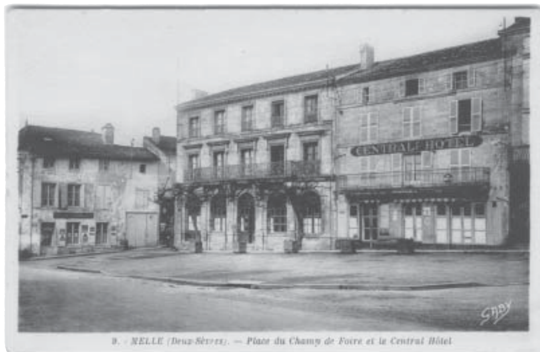
B. - MELLE (Deux-Sèvres). — Place du Champ de Foire et le Central Hôtel

Néanmoins, il a pu suivre quelquefois des parcours de carrière et des destinées singulières car les messages inscrits au dos de ces cartes ont retenu aussi son attention.